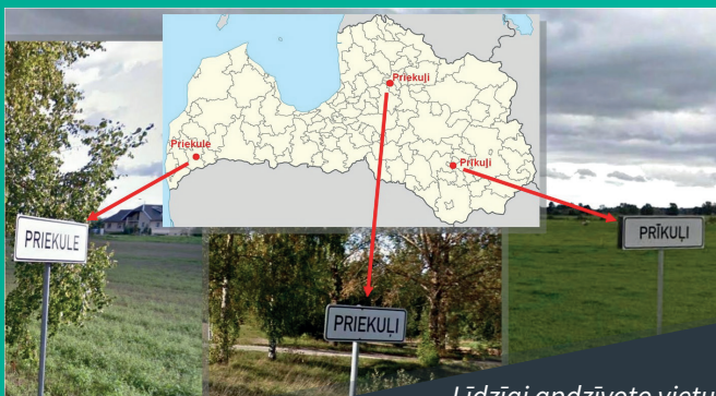
Līdzīgi apdzīvoto vietu nosaukumi dažādos Latvijas novados

Tādēļ objekta viennozīmīgai atpazīšanai , īpaši oficiālā saziņā un kartēs, nepieciešama viena konkrēta nosaukuma un noteiktas pieraksta formas izvēle un tās konsekventa lietošana. To nodrošina, piešķirot vietvārdam oficiālu statusu .