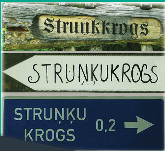
Viena nosaukuma trīs varianti ceļa norādēs

Vietvārds ir vietas nosaukums. Tas var būt gan dabas objekta, gan apdzīvotas vietas vai cita ģeogrāfiska objekta nosaukums.