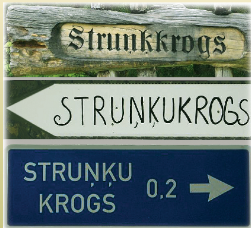
Viena nosaukuma trīs varianti ceļa norādēs

Vietvārds ir vietas nosaukums. Tas var būt gan dabas objekta, gan apdzīvotas vietas vai cita ģeogrāfiska objekta nosaukums.